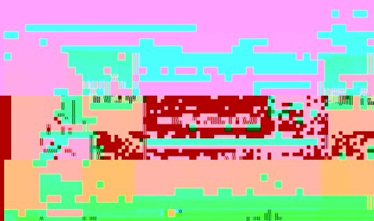
教育学院2010年度学术交流会会场

为深入贯彻落实科学发展观，扎实推进“十二五”规划开局之年，各院系、各部门紧紧围绕学院年度重点工作，广泛深入开展学术交流活动，为师生员工提供学术交流、展示学术成果的重要平台，对于学院人才培养、学科建设、管理服务等各项工作具有重要意义。